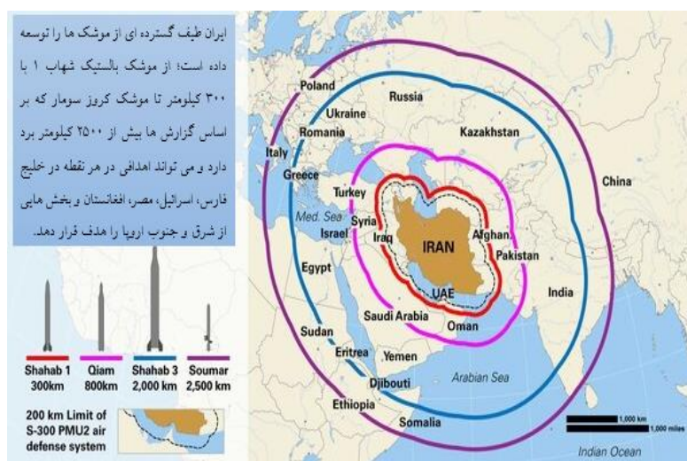
برگردان متن نقشه از منبع: (MilitaryTimes, South et al, 2019)